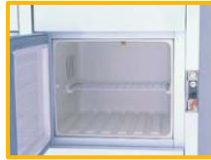
棚板をおろせば簡単に2段式として使用可能