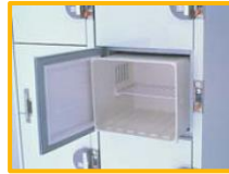
取り外しが簡単で、庫内清掃ラクラク