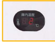
マイコン制御デジタル温度表示を採用