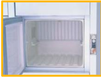
間口が広くて大きい