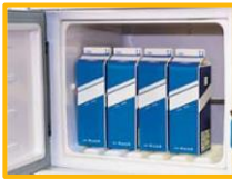
牛乳1リットルパックを立てたまま収納可能