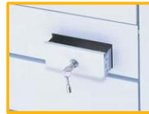
コイン回収ボックス(コイン式)